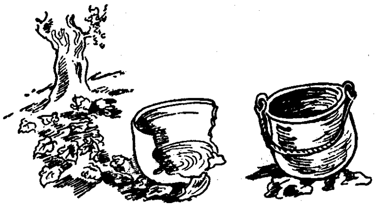
የብረት ፡ ድስትና ፡ የሸክላ ፡ ድስት ።

አንድ ፡ ቀን ፡ ብረት ፡ ድስት ፡ ሸክላ ፡ ድስትን ፡ አለው ። እኔን ፡ ነው ፡ በሁሉም ፡ መልክህ ፡ የሚመስለው ። ወንድሜ ፡ ነህ ፡ እኮ ፡ ባታውቀው ፡ ነው ፡ እንጂ ፣ ከዛሬ ፡ ጀምሮ ፡ እንሁን ፡ ወዳጄ ። እኔን ፡ እንደ ፡ መቅረብ ፡ መሸሽህ ፡ ለምን ፡ ነው ፡ ለካሌ ፡ አካላትህ ፡ የኔ ፡ ቤት ፡ ያንተም ፡ ነው ። አሁንም ፡ በል ፡ ተነሥ ፡ ፍቅራችንም ፡ ይጥና ፣ ሽር ፡ ሽር ፡ እያልን ፡ እንናፈስና ። መፋቀራችንን ፡ ይይልን ፡ ሰው ፡ ሁሉ ፣ የግንተዋወቅ ፡ ለምን ፡ ነው ፡ መምሰሉ ። አጥቂ ፡ ቢመጣብህ ፡ ዘሎ ፡ የሚግታ ፣ እኔ ፡ እሆንሃለሁ ፡ ጎይለኛ ፡ መከታ ፣ ለፀሐይ ፡ ላባራው ፡ እየሆንኩህ ፡ ድንኳን ፣ እደግናሃለሁ ፡ ቢያነቅፍህ ፡ እንኳን ። በደካማነቱ ፡ ቅር ፡ እያለው ፡ ሆኗ ። ተነሣ ፡ ሸክላ ፡ ድስት ፡ አንድነት ፡ ሊሄዱ ፣ አንድ ፡ መቶ ፡ እርምጃ ፡ እንደ ፡ ተራመዱ ፣